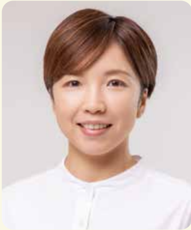
小平 奈緒 さん